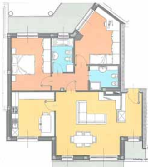
TRILOCALE ( size L )