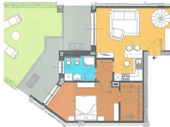
BILOCALE ( size M )