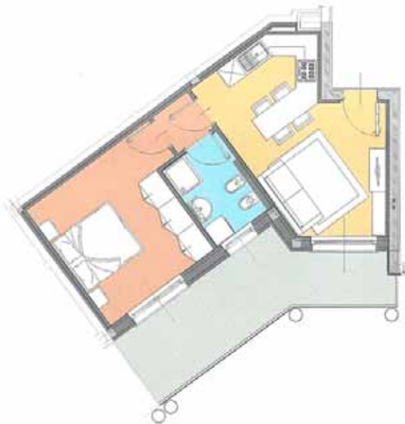
BILOCALE ( size S )