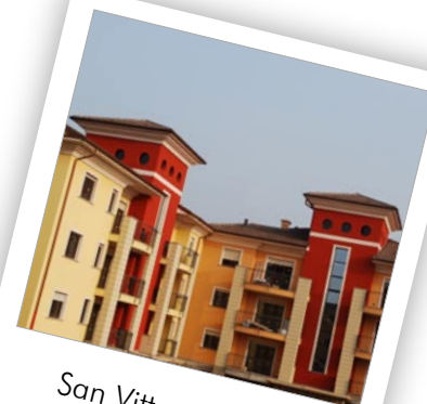
San Vittore Olona